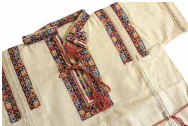
Obr. 2: Košielka detská. Spolok Izabella. Múzeum ľudovej umeleckej výroby ÚLUV.