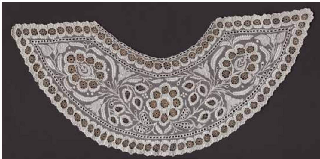
Obr. 1: Vyšivávaný golier na ženské šaty. Spolok Izabella. Múzeum Ľudovej umeleckej výroby ŰLUV