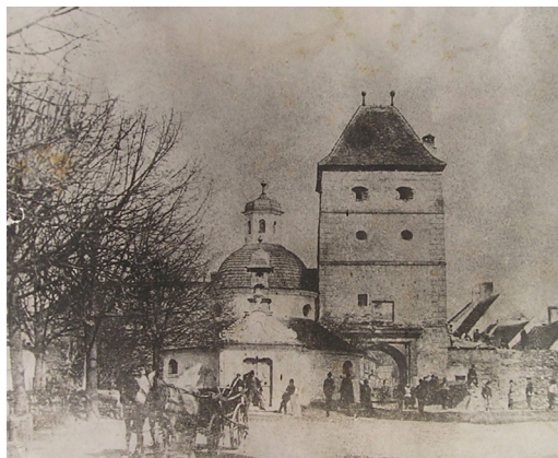
Obrázok č. 2: Dolná brána