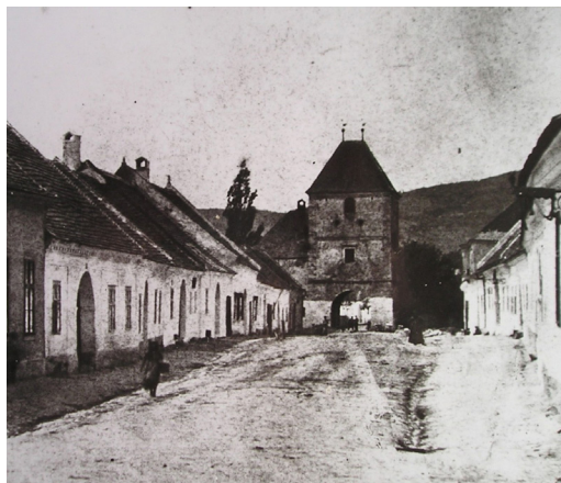
Obrázok č. 4: Pezinská brána