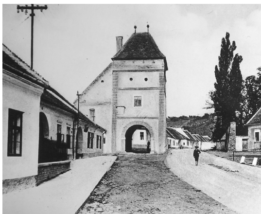
Obrázok č. 3: Horná brána