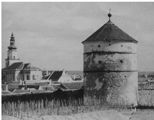
Obrázok č. 1: Valcovitá bašta